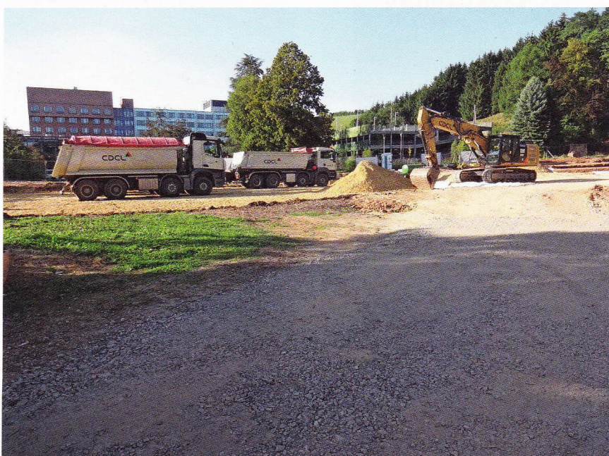
Die Arbeiten am „Lycée technique pour professions de santé“ haben begonnen.

Das Centre Hospitalier du Nord (CHdN) verbessert die Parkplatzsituation für Personal und Besucher. Das Parkhaus drängte sich auf, weil ein Teil des bestehenden Parkingareals von der Gemeinde an den Staat verkauft wurde. Auf diesem Gelände entsteht der längst notwendige Neubau des „Lycée technique pour professions de santé“. Somit haben wir die Grundlage dafür geschaffen, dieses Lyzeum in unserer Gemeinde zu behalten, den Gesundheitsstandort zu stärken sowie die Ortschaft Warken zu entlasten.