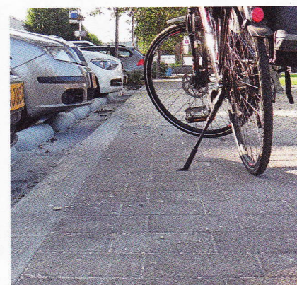
Sicherung des Fahrradweges

Zur Förderung der alternativen Mobilität arbeiten wir an der Umsetzung eines Gesamtkonzeptes. Erste Schritte sind die Absenkung der Bürgersteige und die Sicherung – wenngleich es ein Kompromiss und kein Ideal ist – des Fahrradweges durch die Avenue Salentiny. Weitere Schritte werden zeitnah folgen.