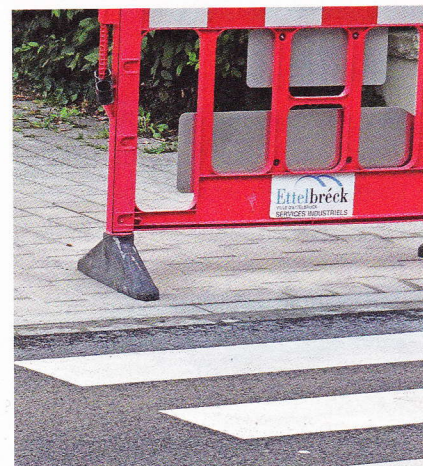
Absenkung der Bürgersteige

Die E-Bike Verleihstationen werden ausgebaut. Zwei Verleihstationen in Warken und eine bei der Sporthalle zeugen vom konsequenten Willen der CSV-LSAP-Mehrheit, gegen die Stimmen der Grünen (!) und der Liberalen, alternative Mobilität zu fördern.