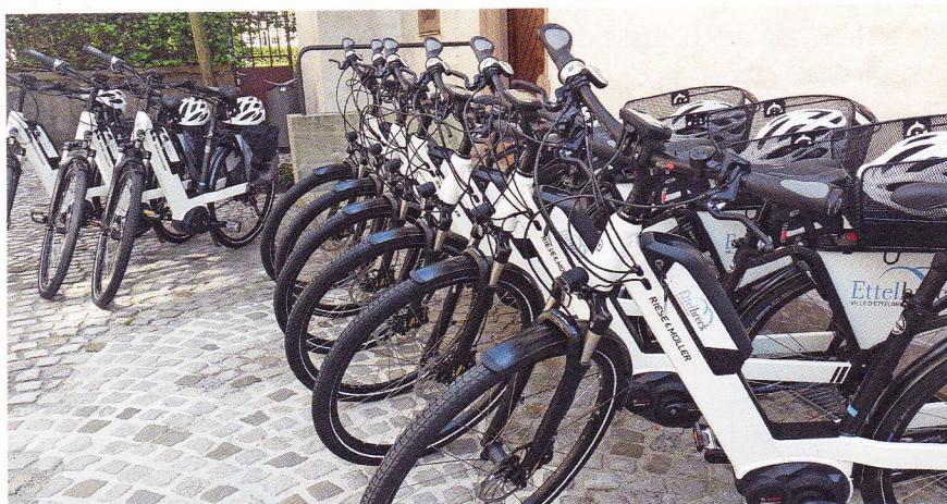
Zehn E-Bikes für die innerstädtischen Dienstwege der Mitarbeiter