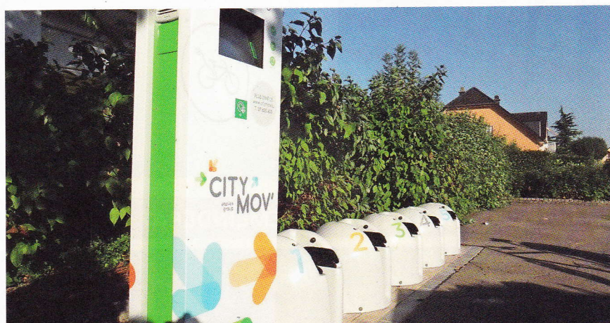
Neue Station in Warken

Zudem haben wir zehn Elektrofahrräder für die Gemeindedienste angeschafft, die sich großer Beliebtheit beim Personal erfreuen. Viele dienstrelevante Strecken können nun mit der sanften Mobilität zurückgelegt werden.